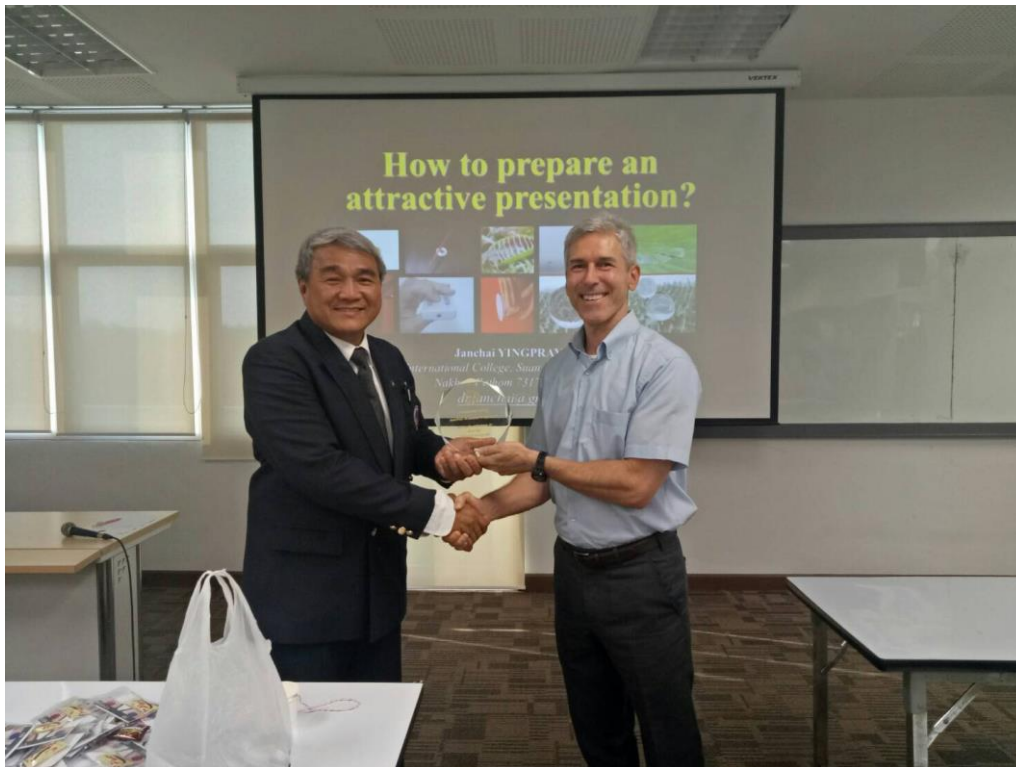
ทักษะการนำเสนอ และการเป็นพิธีกรอย่างมืออาชีพ