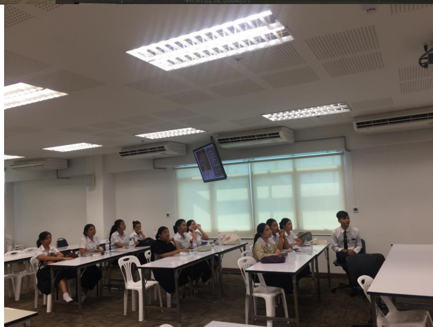
ทักษะการนำเสนอ