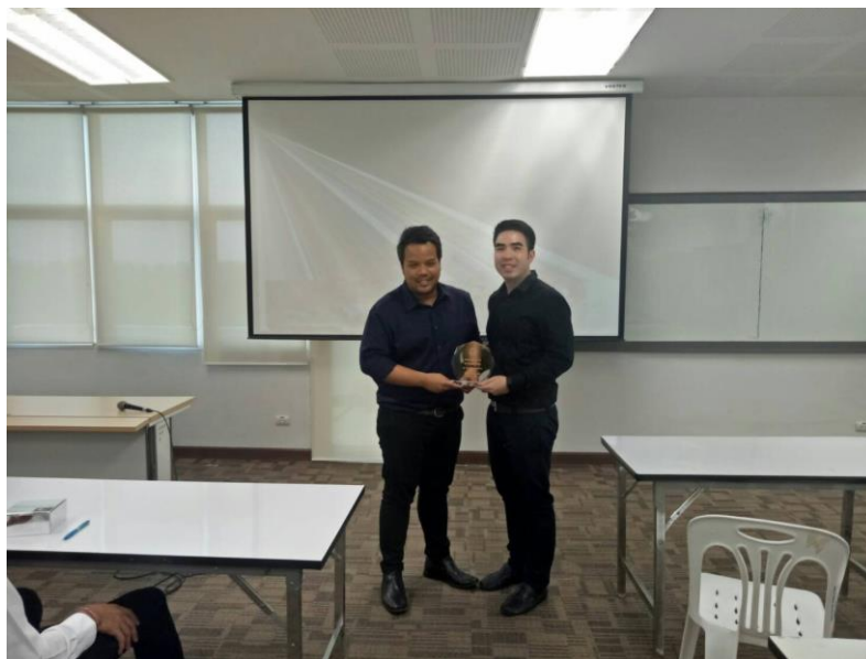
ของที่ระลึกให้วิทยากร