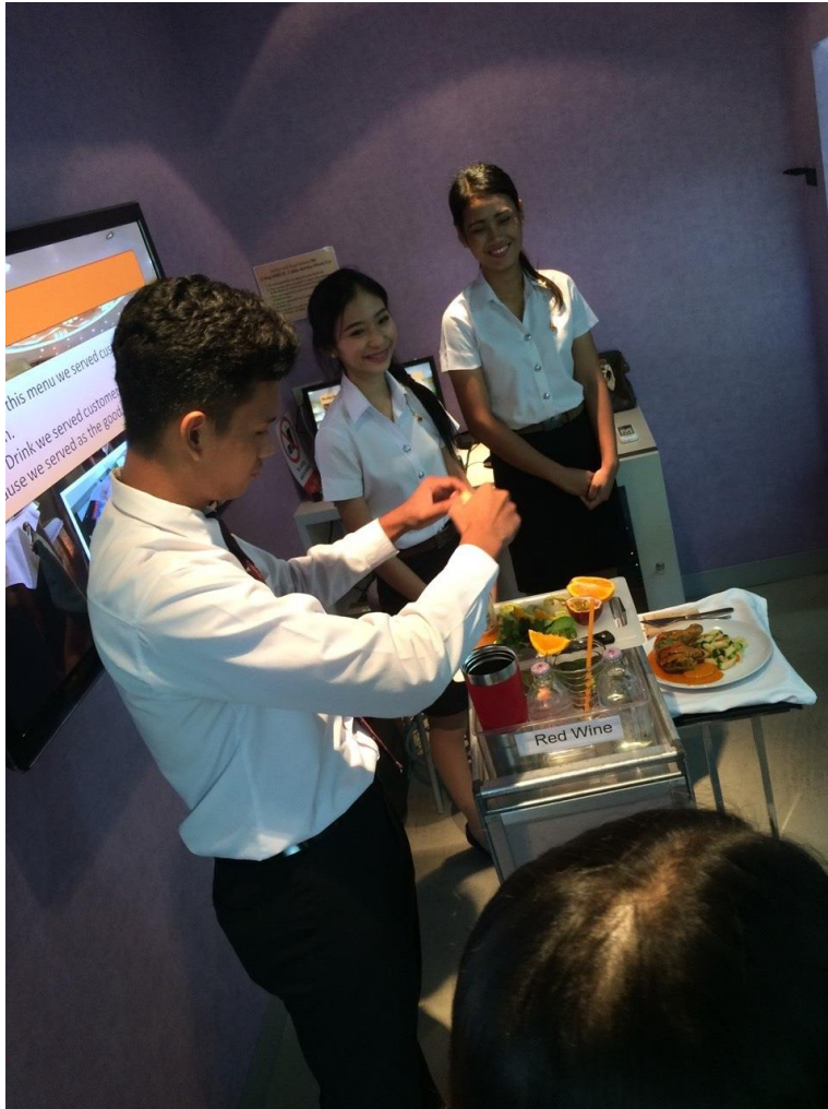
นิทรรศการการนำทักษะการนำเสนอมาใช้ของของนักศึกษา