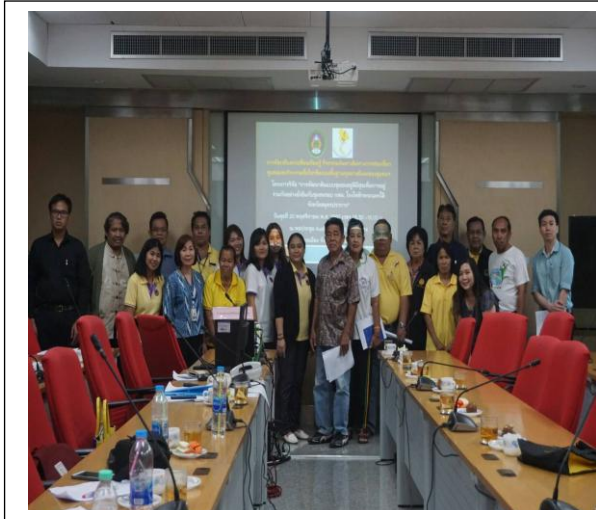
ภาพที่ 1 -4 การประชุมกลุ่มกับตัวแทนชุมชน